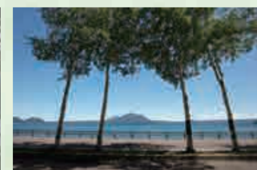
4 風不死岳(ふうふしだけ) ビューポイント 支笏湖を一望