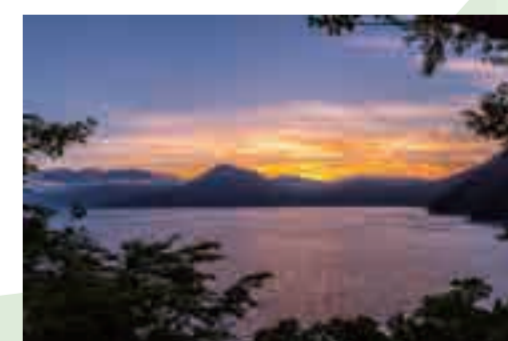
3 ポロピナイ駐車帯 山並みと夕日