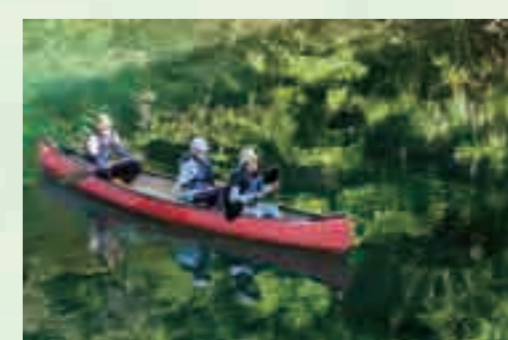
5 千歳川・支笏湖アクティビティ