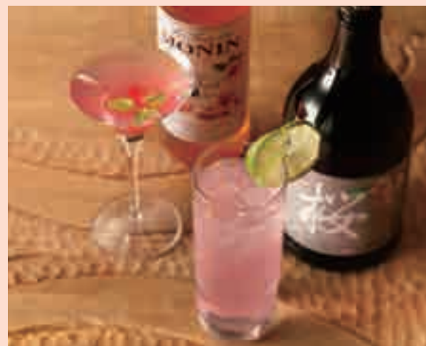
【写真右】 SAKURAトニック ¥1,100(税込)

本場ニューヨークでバーテンダーとして活躍した経験を活かし、お客様の思いの形を「カクテル」にしてお届けいたします。