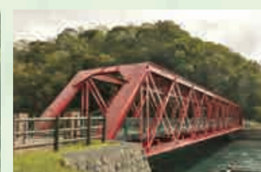
6 千歳川の源流・山線鉄橋