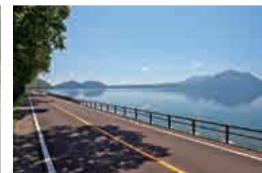
2 支笏湖、風不死岳と樽前山