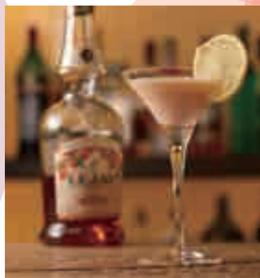
水の調春のカクテル ¥1,100(税込)

BAR APEの春のカクテルは、杏子の香りが漂い女性に人気の『水の調春のカクテル』、桜の香り高い甘さの中にもすっきりとした飲み口の『SAKURAトニック』、爽快感を味わえるしつかりとした飲み口の『チェリーブラッサム』の春を感じる3種類を味わえます。