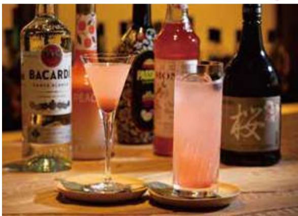
【写真左】桃花 -トウカ- ¥1,100(税込) 【写真右】桜が降る夜は ¥1,100(税込)

支笏湖ビールから山シリーズ第4弾。シリーズで最も低アルコールの3.5%。春の爽やかな新緑を眺めながら、ぜひご賞味ください。