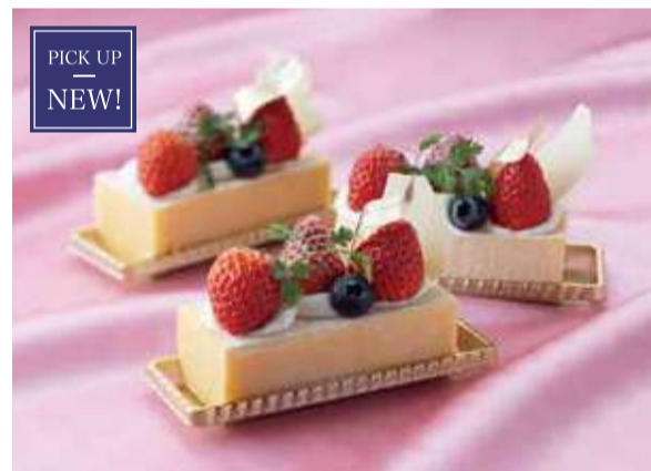
フリユイブランシュ ¥700(税込)

桜の香りがふわりと漂う春ならではのショートのカクテル「桃花」。桃のさっぱりとした甘味と春の色を愉しめる「桜が降る夜は」。春をイメージした2種の季節のカクテルをご用意しました。しこつ湖に咲く夜桜とともに、ゆっくりとした時間が流れるバー「アベ」で、特別な今日だけの大人の時間をお過ごしください。