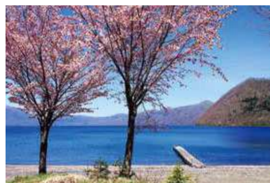
しこつ湖の澄み渡る青と満開の桜が織りなす春にしか見ることができない絶景は、1年の中でもまさに特別なもの。

支笏三山の一つとされる樽前山を巡るツアーでは、北海道指定文化財の天然記念物にも指定されている山頂部の溶岩ドームと、しこつ湖の大パノラマを目指し、美しい景色と大自然を全身で感じる体験を味わうことができます。また、恵庭岳の西山麓にある原生林に囲まれた神秘的湖・オコタンベ湖や、周辺に広がる広大な森の中をE・BIKEで爽快に駆け抜けるツアーなど、しこつ湖が誇る大自然を余すところなく愉しむアクティビティをご用意しております。プライベートガイドが同行のもと、安全に自然を満喫する旅へご案内します。